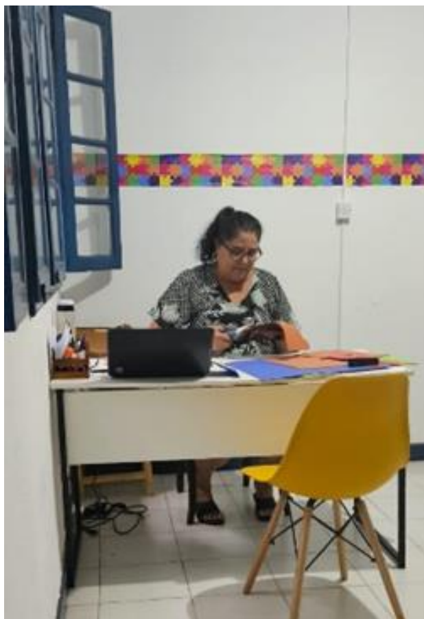
Elaboração de relatório do serviço social para apresentação ao Conselho Municipal de Assistência Social

Registrada no CMDCA de Taubaté sob o nº 12013 0076