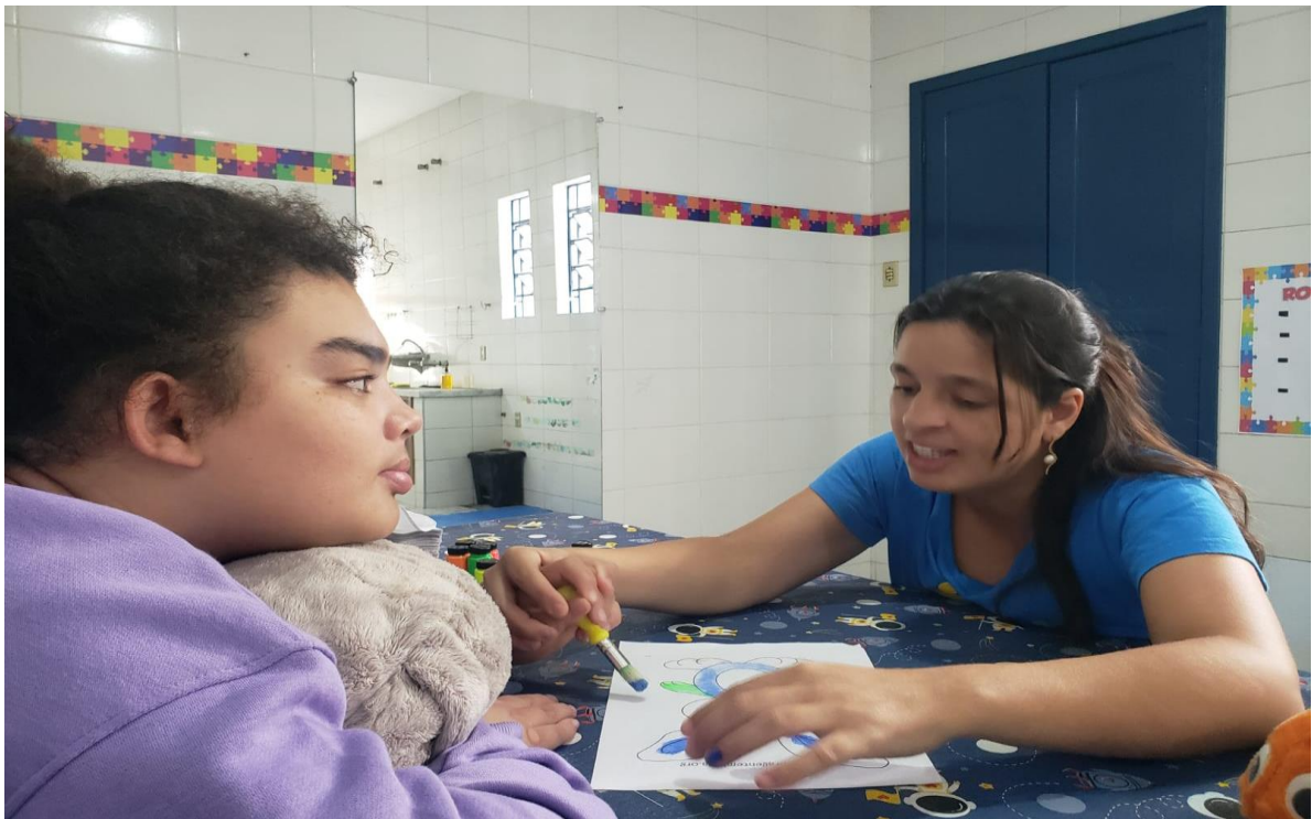
Atendimento de crianças na sede do projeto