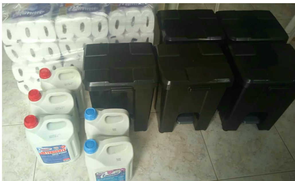
Custeio de material de papeleria para utilização no projeto