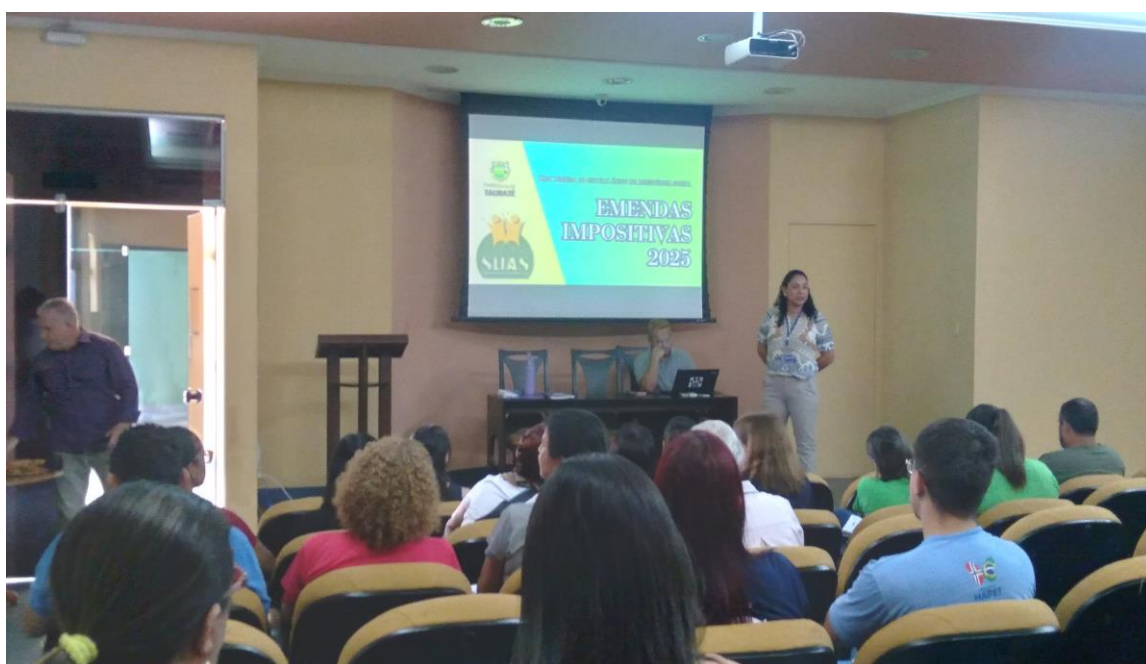
Reunião com a equipe da SEDIS sobre plano de trabalho para emendas parlamentares de 2025