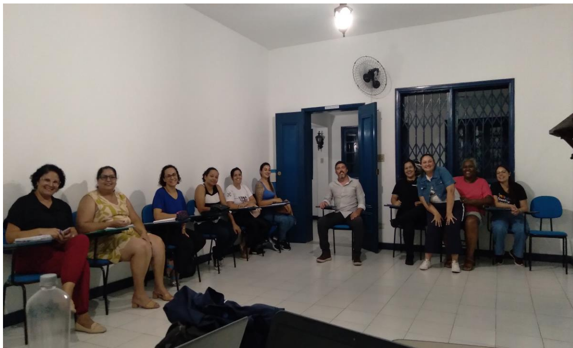
Reunião de alinhamento com a equipe técnica e administrativa do projeto

Registrada no CMDCA de Taubaté sob o nº 12013 0076