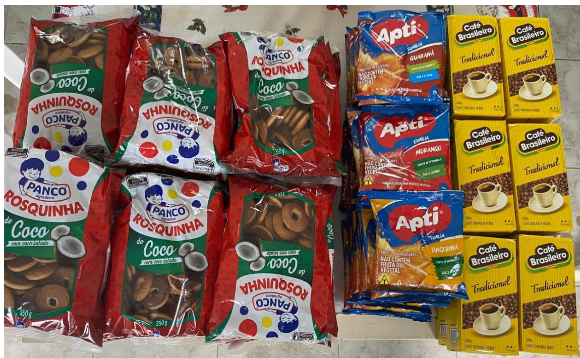
Custeio de materiais de limpeza e descartáveis para utilização no projeto