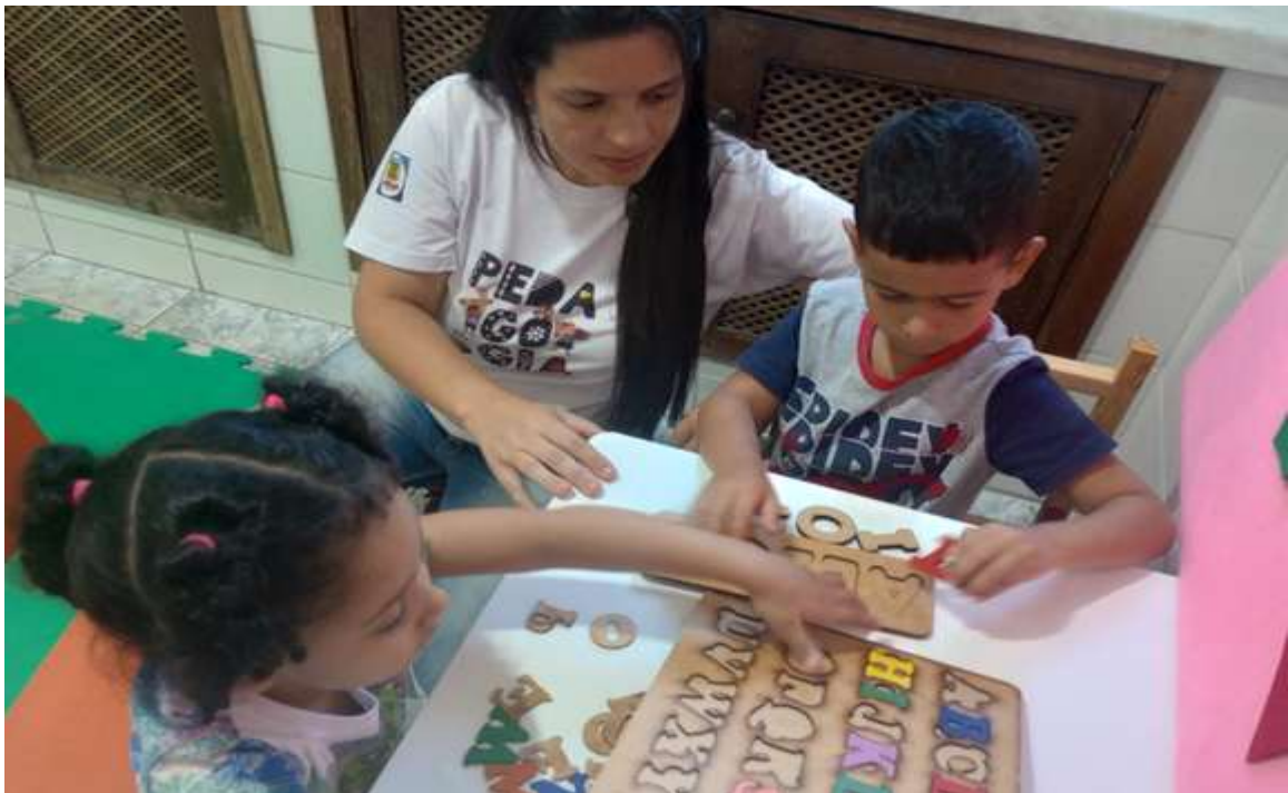
Realização de atividades de pedagogia com jogos de montar palavras