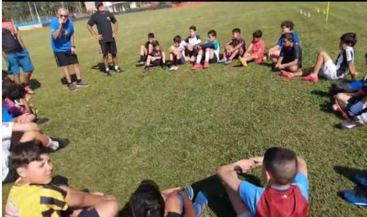
Realização de atividades de esporte

Registrada no CMDCA de Taubaté sob o nº 12013 0076