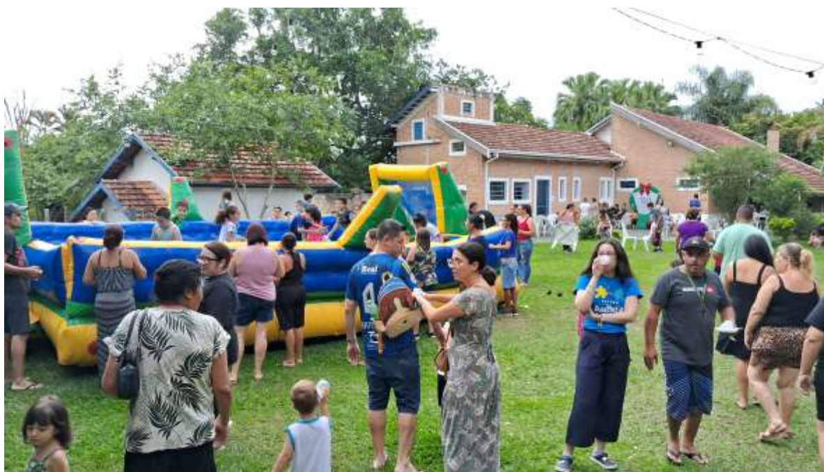
Atividades de recreação durante festa de Natal com as crianças atendidas e suas famílias