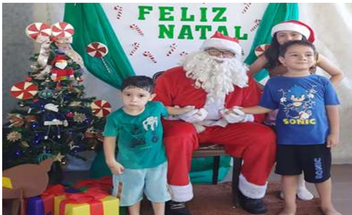
Entrega de presentes para as crianças atendidas durante festa de Natal no projeto

Registrada no CMDCA de Taubaté sob o nº 12013 0076