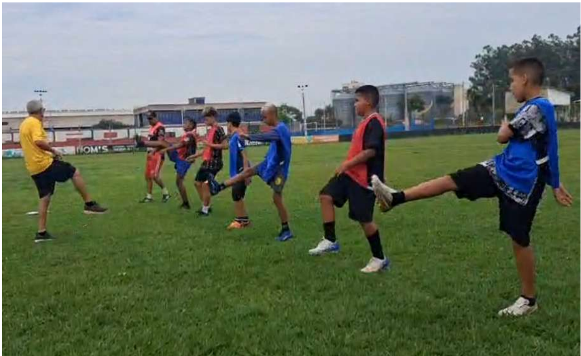
Realização de atividades de esporte