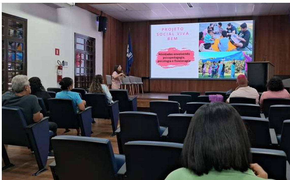
Participação das coordenações técnica e administrativa em reunião com a SEDIS