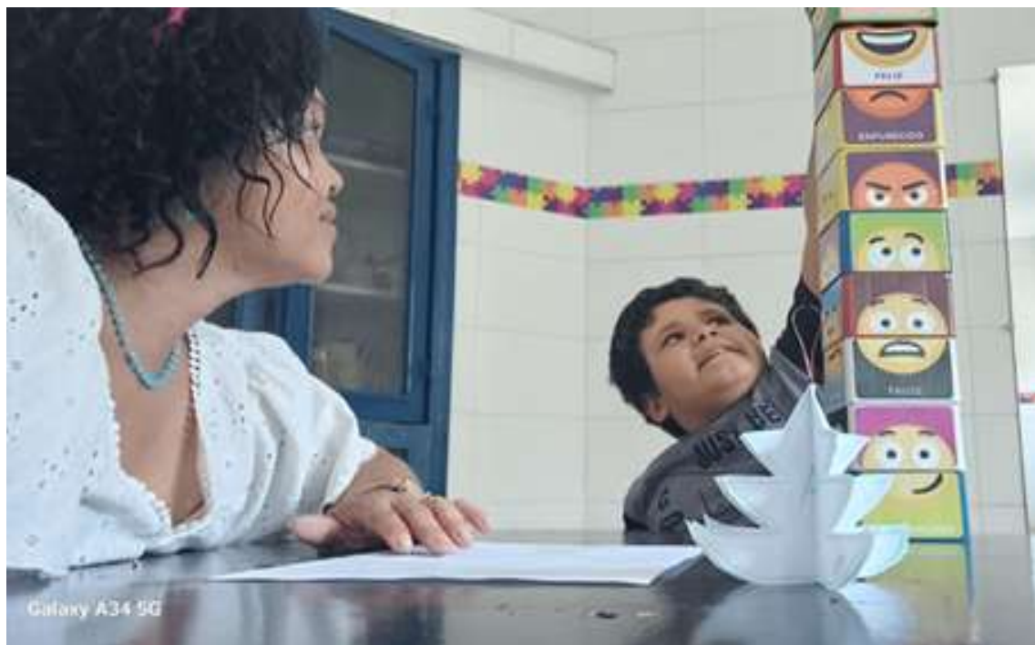
Realização de jogos envolvendo psicopedagogia e psicomotricidade

Registrada no CMDCA de Taubaté sob o nº 12013 0076