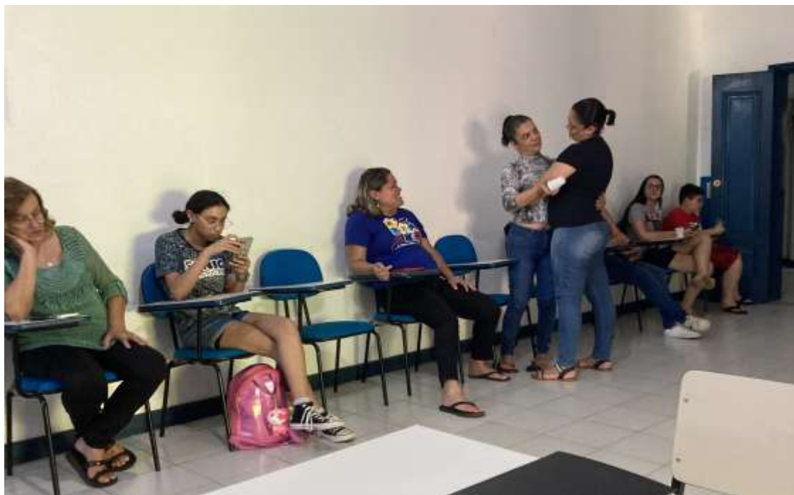
Momento de interação social e afeto entre mães de crianças com TEA na recepção do projeto

Registrada no CMDCA de Taubaté sob o nº 12013 0076