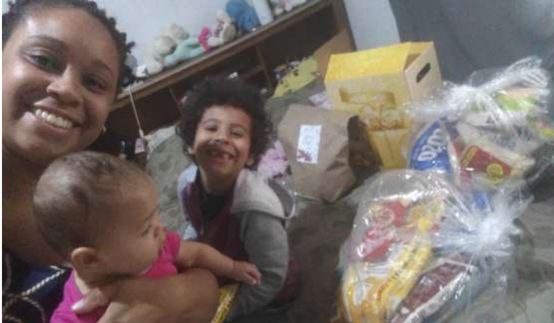
Visita domiciliar do serviço social à residência de família de criança atendida com entrega de doação

Registrada no CMDCA de Taubaté sob o nº 12013 0076