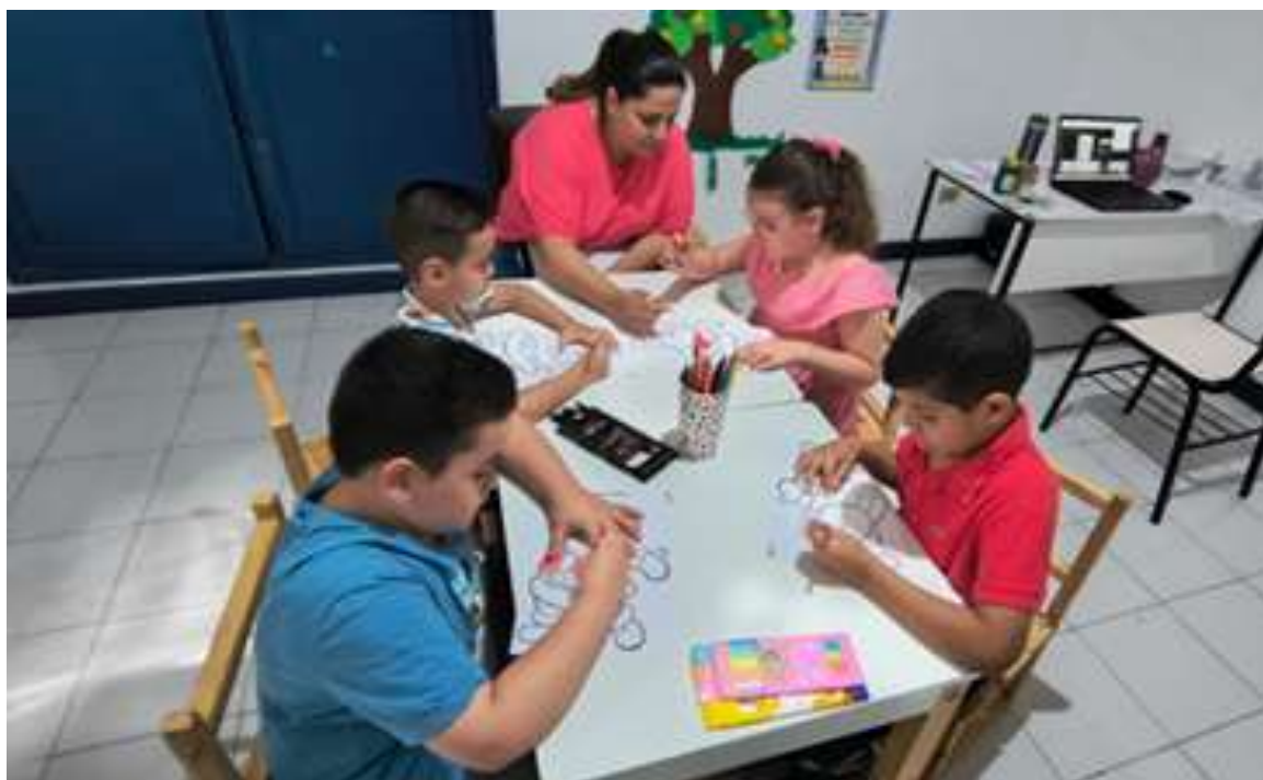
Crianças fazendo cartões de Natal para suas famílias, fortalecendo expressões de afeto familiar