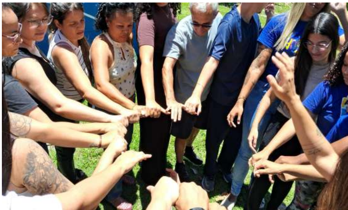
Dinâmica de comunicação e trabalho em equipe em treinamento oferecido para profissionais do projeto

Registrada no CMDCA de Taubaté sob o nº 12013 0076