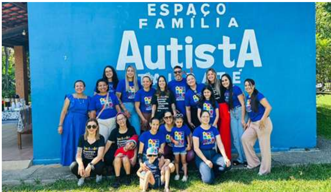
Equipe do projeto após preparativos para festa de Natal para as crianças atendidas e suas famílias