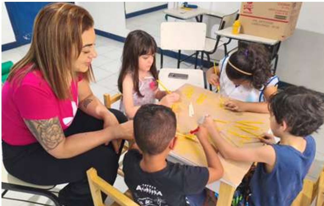
Atividades de fisioterapia envolvendo desenvolvimento motor fino e socialização

Registrada no CMDCA de Taubaté sob o nº 12013 0076