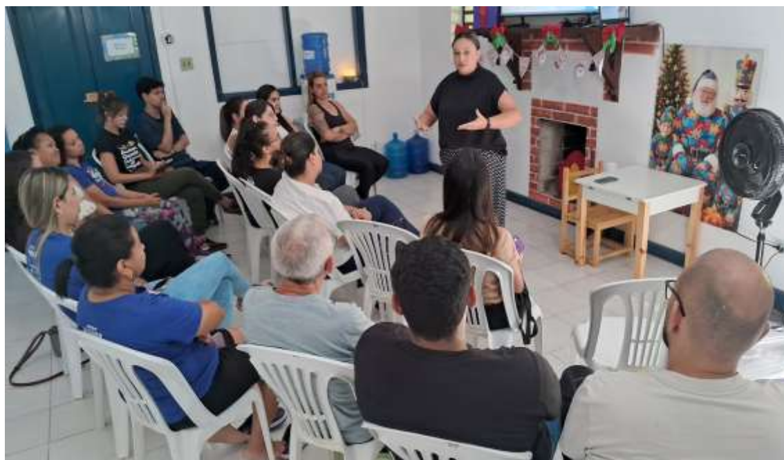
Treinamento de comunicação oferecido para a equipe técnica e administrativa do projeto