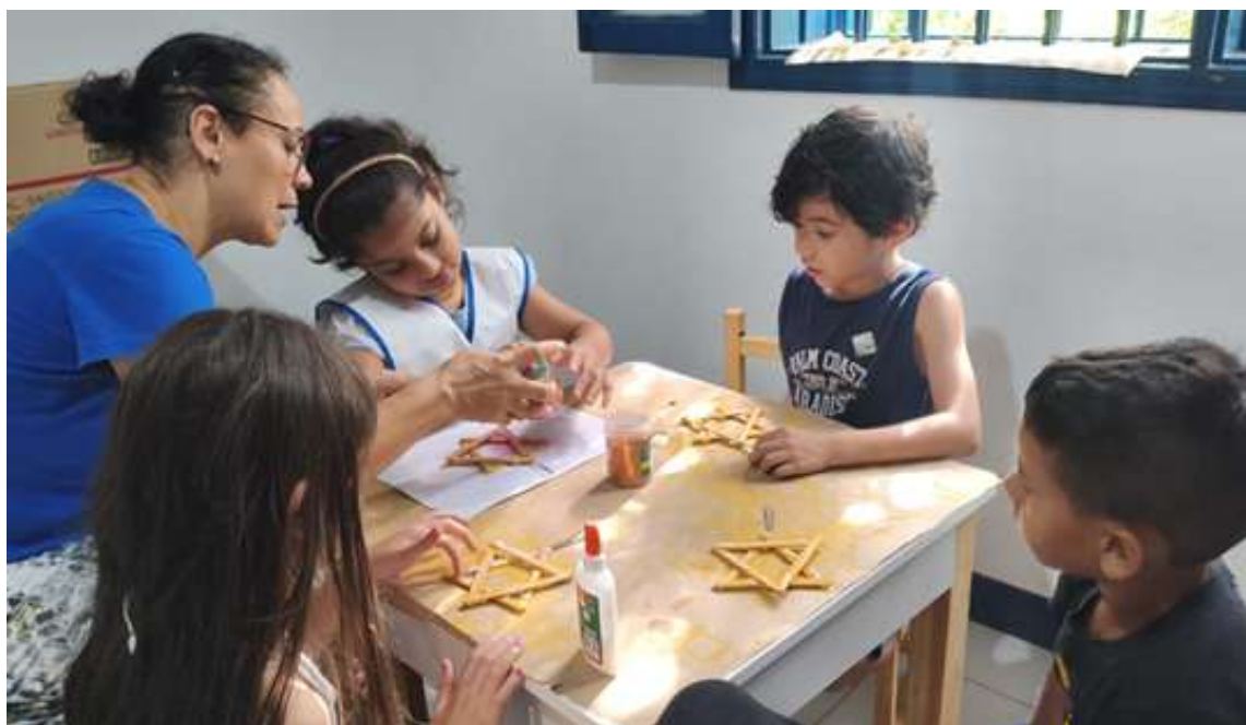
Atividades de psicologia envolvendo compartilhamento de materiais e interação social